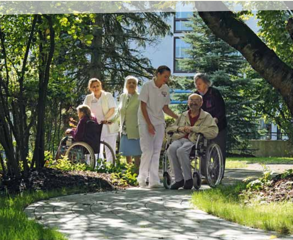
Das Altenzentrum am Hühnerberg verfügt über einen schönen Park. Das Haus vereint stationäre Pflege und Betreutes Wohnen.

Die drei Einrichtungen der AWO in Memmingen werden allen Ansprüchen gerecht.