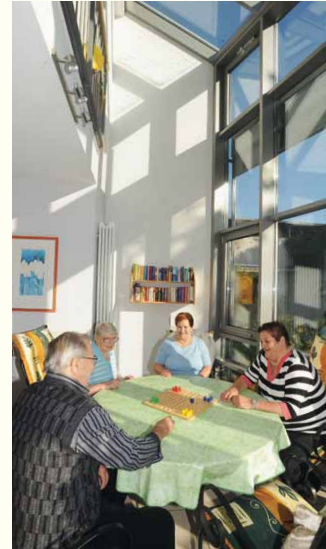
Geselligkeit ist Trumpf im Wintergarten des MeWo-Seniorenzentrums Badgasse.