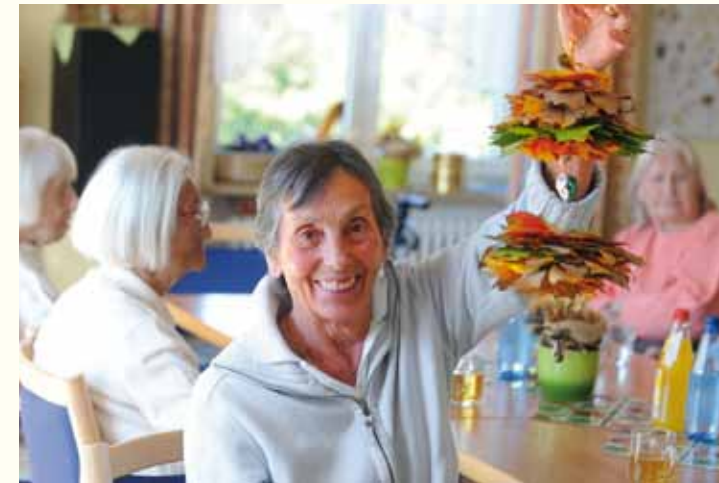
Der Aufenthaltsbereich der Pflegestation MeWo-Park ist ein beliebter Treffpunkt.

Mit nur 29 Plätzen, überwiegend in attraktiven Einzelzimmern, bietet die großzügig eingerichtete Pflegestation an der Buxacher Straße optimale Voraussetzungen für eine individuelle Betreuung und Pflege. Helle, freundliche Gemeinschaftsräume bieten Platz für Begegnungen. Dank der sehr zentralen Lage ist der Marktplatz in wenigen Minuten zu Fuß erreichbar.